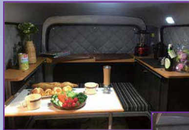
ダイネットモード