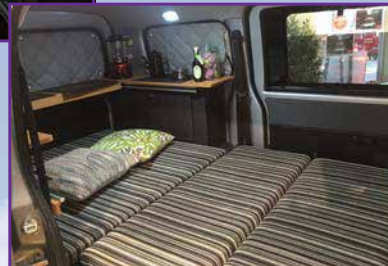
ベッドモード ※クッション等のインテリアは含みません。