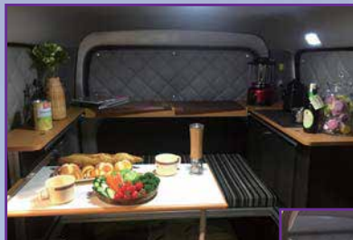
ダイネットモード