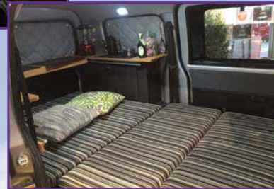
ベッドモード ※クッション等のインテリアは含みません。